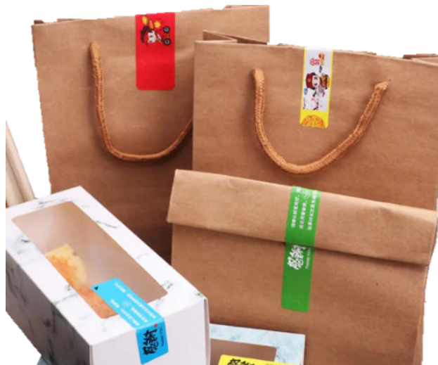
图 B.2 食安封签 2