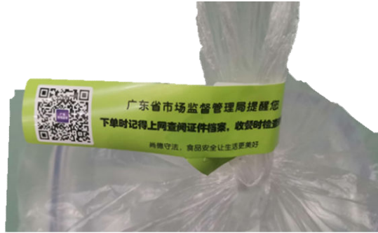
图 B.1 食安封签 1