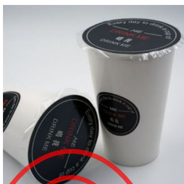
图 A.7 过塑机封口