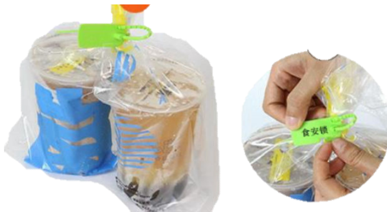
图 B.3 食安锁