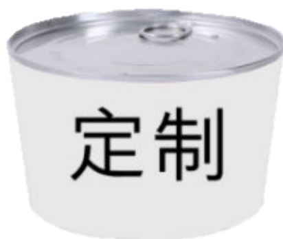
图 A.4 易拉罐式餐盒