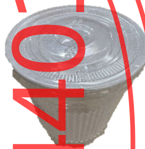
图 A.8 防漏纸封口