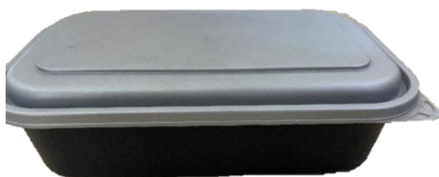
图 A.6 卡槽式餐盒