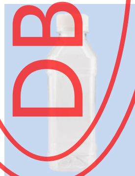
图 A.9 螺旋式饮料瓶