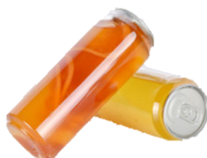
图 A.10 易拉罐式封口