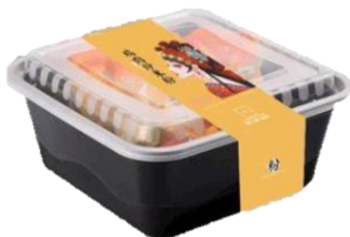
图 A.5 一次性热敏纸封口