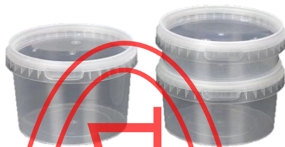
图 A.1 一次性卡扣式餐盒

A.1 主食、菜品类食物宜采用图 A.1 至图 A.6 的密封方式，汤品类食物宜采用图 A.1 至图 A.4 的密封方式。