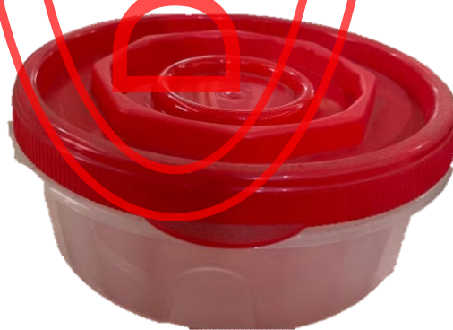
图 A.3 螺纹式餐盒